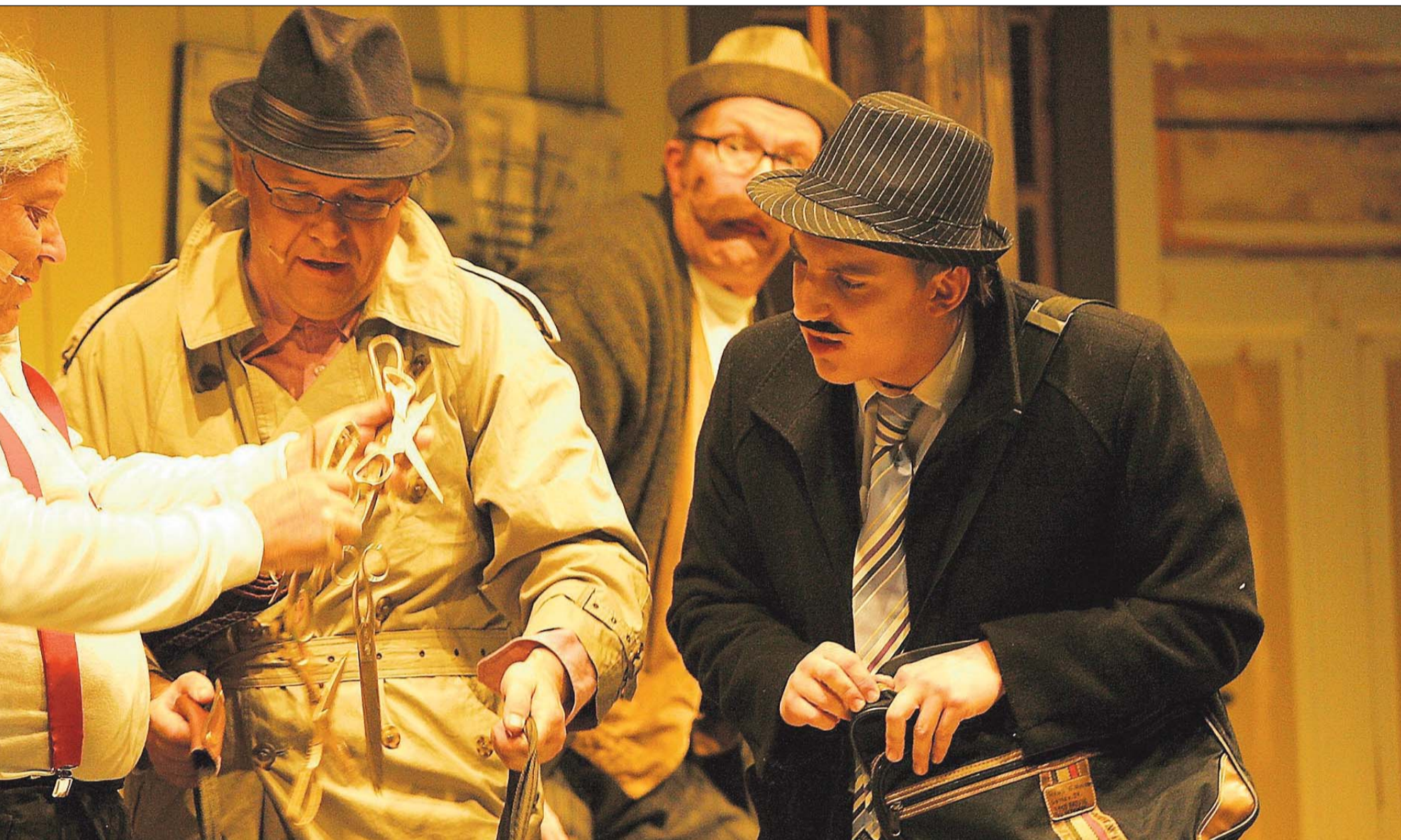
Lia ville kvitte seg med «gaver» i bruktbutikken.