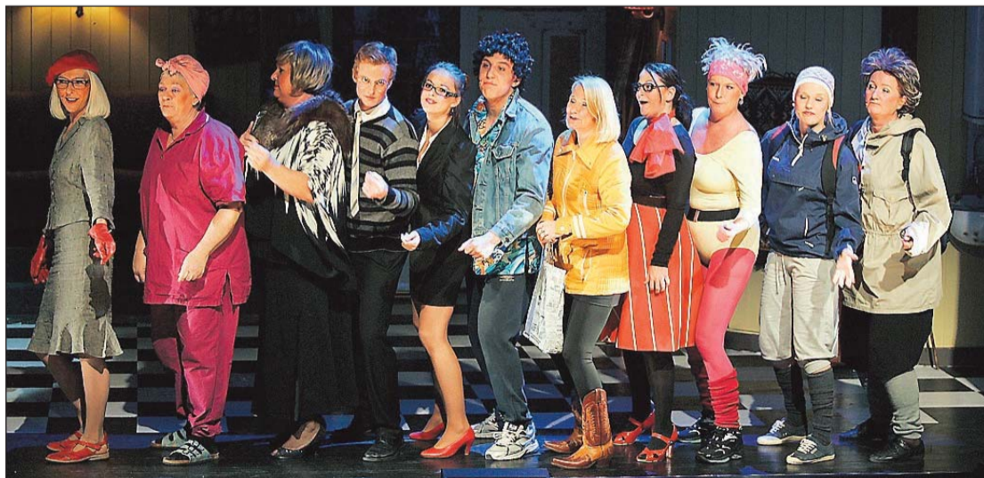
SANGLØFT: Sangnummer utgjorde en stor del av revyen, og inneholdt gode tekster og fengende melodier.

turgi var bygget rundt dette. Det samme gjaldt for de to faste «gjestene», som anså lokalet som både et egnet kaffested og plassen der en kan høre det meste som skjer i byen. Med stadig innspill fra de to her-